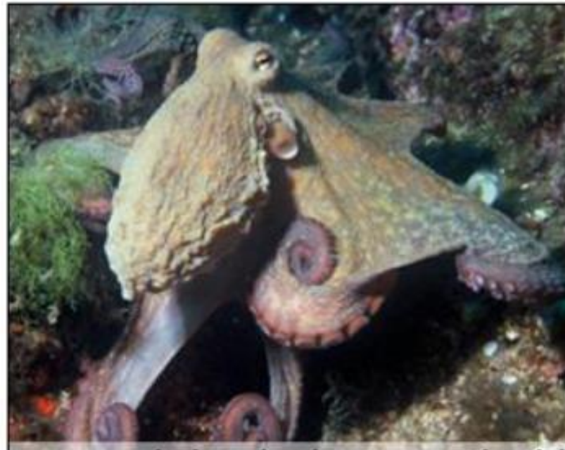
Vrsta hobotnice ( Octopus vulgaris )