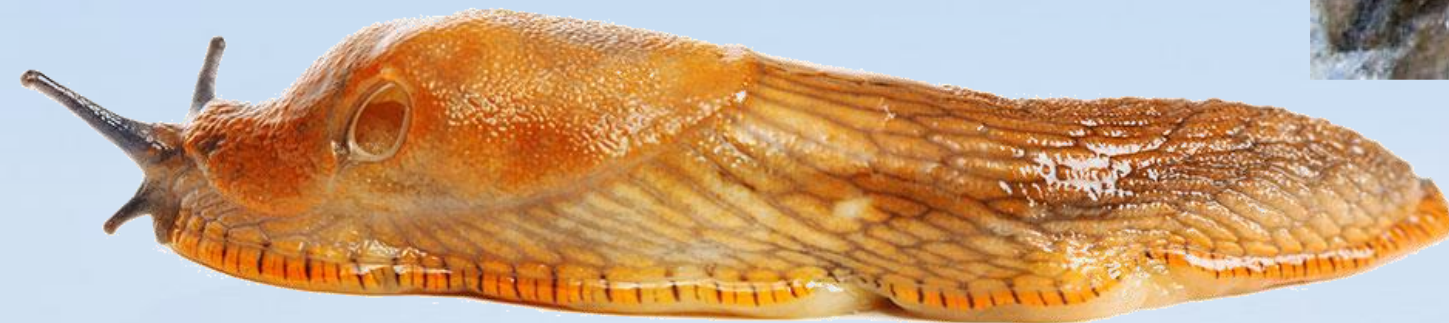
Skiciraj POLŽA LAZARJA