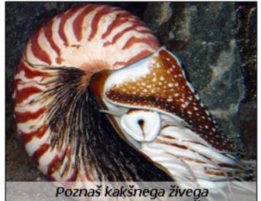
Poznaš kakšnega živega fosila iz skupine glavonožcev?