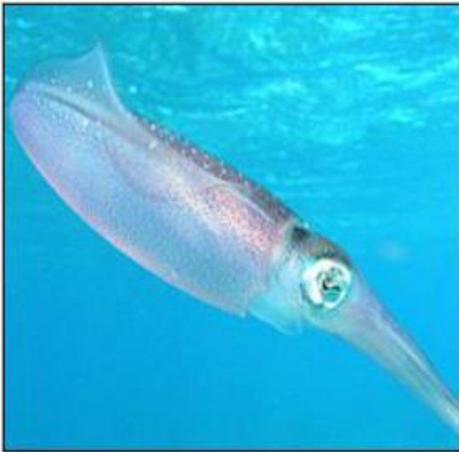
Vrsta lignja ( Sepioteuthis sepioidea ).